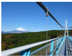
三島スカイウォーク