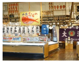
沼津グルメ街道の駅