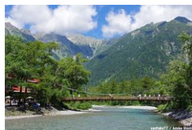
河童橋 穂高連峰を望む