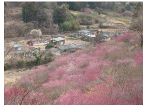
あぶた福寿草の里