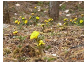
あぶた福寿草の里