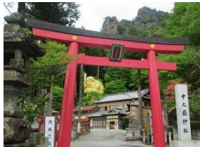
妙義山 中之嶽神社