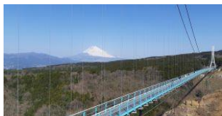
三島スカイウォーク