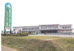
伊豆フルーツパーク