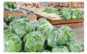
道の駅あぐりいち

標高約750mの奥只見湖。面積は、約11.5km 2 の大きさと東京都千代田区や文京区とほぼ同じ面積。