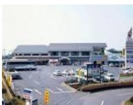
水戸ドライブイン