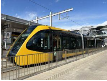
次世代型路面電車ライトレール